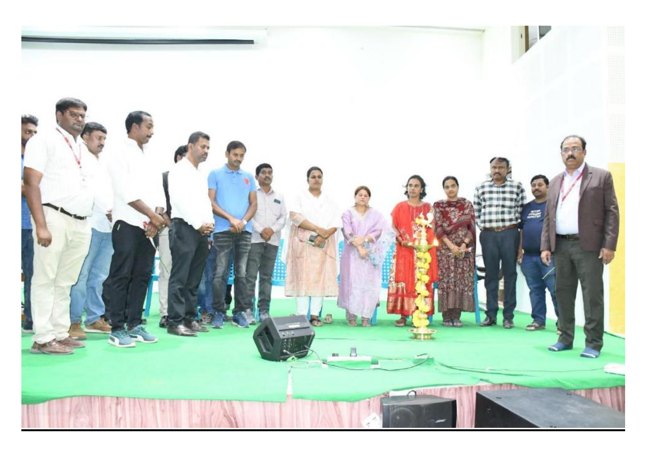
Lightening the kuthuvilaku