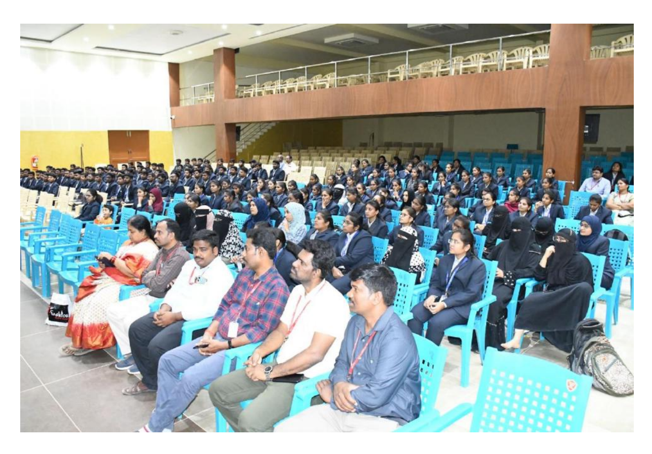
I MCA students – attending the alumni meet