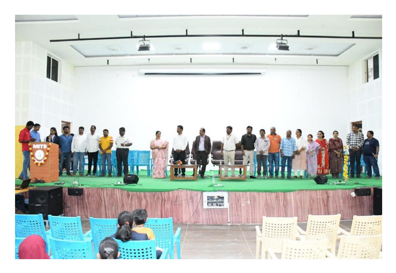
Alumnus attending the meeting